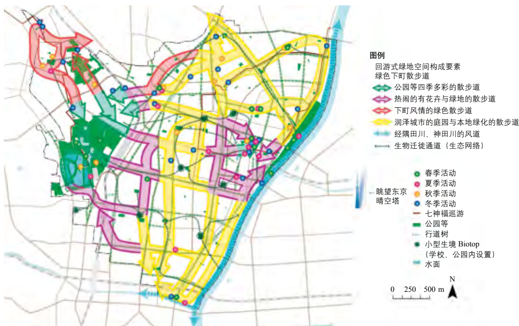
图 6 台东区绿地及水系规划布局图