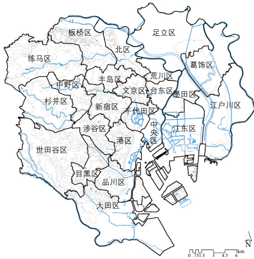
图 1 东京都 23 区行政区概况图

地势相对平坦的 23 区是以古代江户城为中心逐步发展起来的高密度都市区，总面积约 626.7 km 2 ，占东京都总面积的 28.6%；是主要的人口聚集地，集中了约 926 万人口，占东京都总人口的 70.8% [7] ，人口密度达到 1.47 万人/km 2 （图 1）。在