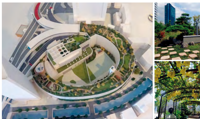
图 3 目黑区天空花园（大桥立交桥屋顶绿化）模型及实景图

首先，目标体系的基础是对于基本理念及未来愿景的提炼。基于现状调查发现的问题，结合城市自然社会条件、绿地现状以及城市未来发展方向，提出绿地规划的基本理念。基本理念是客观审视绿地的作用与价值后，提炼的未来城市