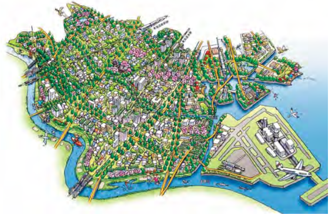
图4 大田区绿地未来愿景规划图 资料来源:参考文献[20]

区民实感指标等三项是各区较为常用的指标,还有绿化覆盖率、绿视率、大型树木保护、绿化活动团体数与参与人数等指标(表2)。需特别说明的是,日本对于“绿地率”和“绿化覆盖率”的定义与我国有所不同。绿地率是绿地基本规划