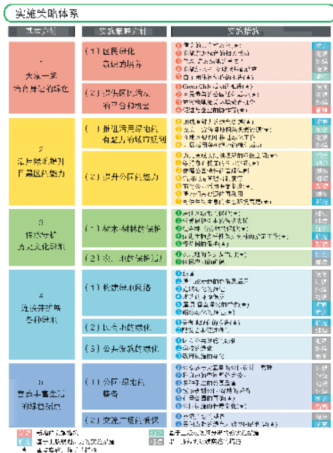
图 7 目黑区规划实施方针及策略体系图

PDCA 循环被广泛运用到各区进程管理体系中。依据“计划 (Plan)、执行 (Do)、检查 (Check)、改善 (Action)”四大步骤，对绿地基本规划实施中的各项环节进行综合管理。以港区为例，由“港区绿地及水系委员会”牵头，在计划阶