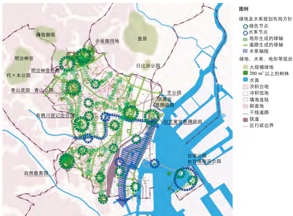
图 5 港区绿地及水系规划布局图

规划布局中另一个重要尺度是区内的下级各行政分区。以区级规划布局为基础，针对区内各行政分区，制定更为详细的绿地及水系规划布局方针和策略。例如千代田区，以地区绿地特色的梳理为基础，提炼各地区核心主题，进一步制